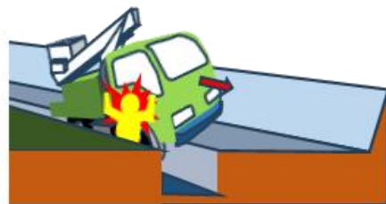
※イラストはイメージ図

⑨ 県内においては、令和5年及び6年に連続して車両の逸走による死亡災害が発生しています。