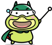
労働基準局広報キャラクター「たしかめたん」