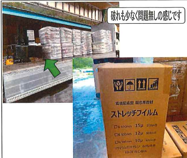
破れも少なく問題無しの感じです