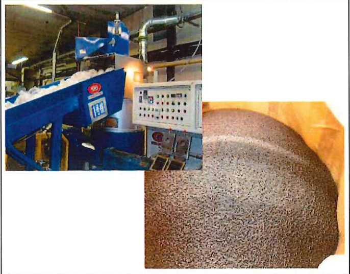
国土で再選別後にペレット製造作業