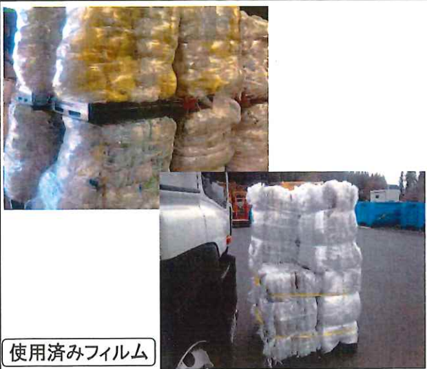
使用済みフィルム