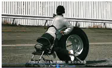
車輪脱落事故啓発動画より (R2. 国交省作成)