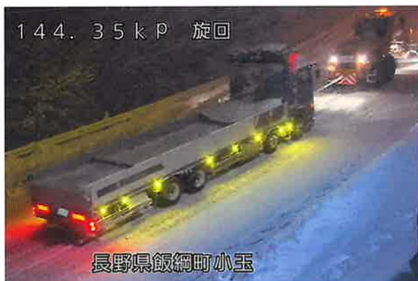
スタック車両の牽引状況(R3年12月17日:国道18号飯綱町)