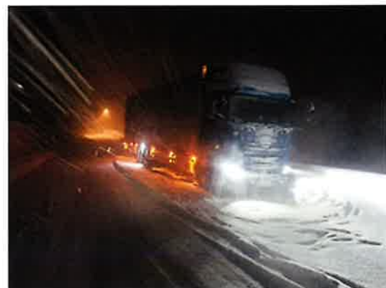
車両のスタック状況(R3年12月18日:国道17号三国峠)