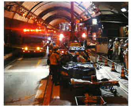
参考:恵那山トンネル防災訓練