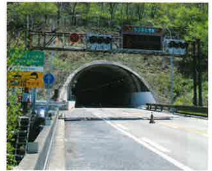
参考:トンネル入口信号