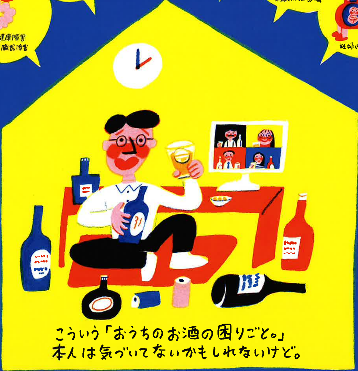
健康障害 肝炎など臓器障害