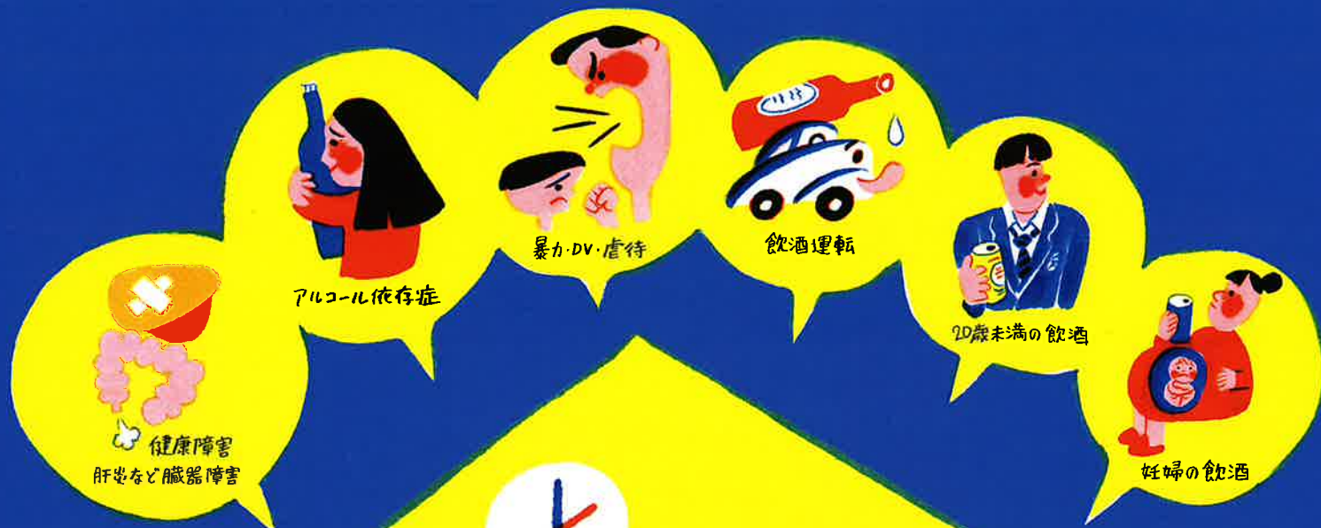
アルコール依存症