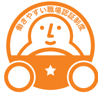
「一つ星」認証マーク

申請受付・認証業務は、国土交通省から、本制度の実施団体に選定された「一般財団法人日本海事協会（通称：ClassNK）」が行います。