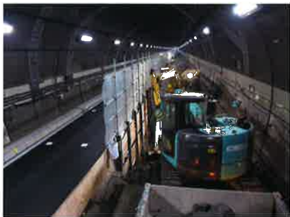
他のトンネルにおける同種の工事写真